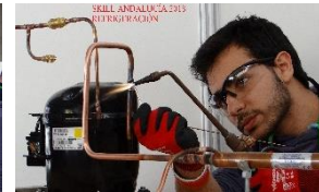
INSTALACIÓN Y MANTENIMIENTO