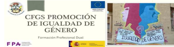
PROMOCIÓN DE IGUALDAD DE GÉNERO