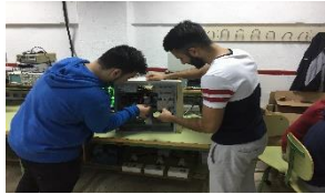
ELECTRICIDAD / ELECTRONICA