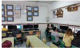
MADERA MUEBLE Y CORCHO